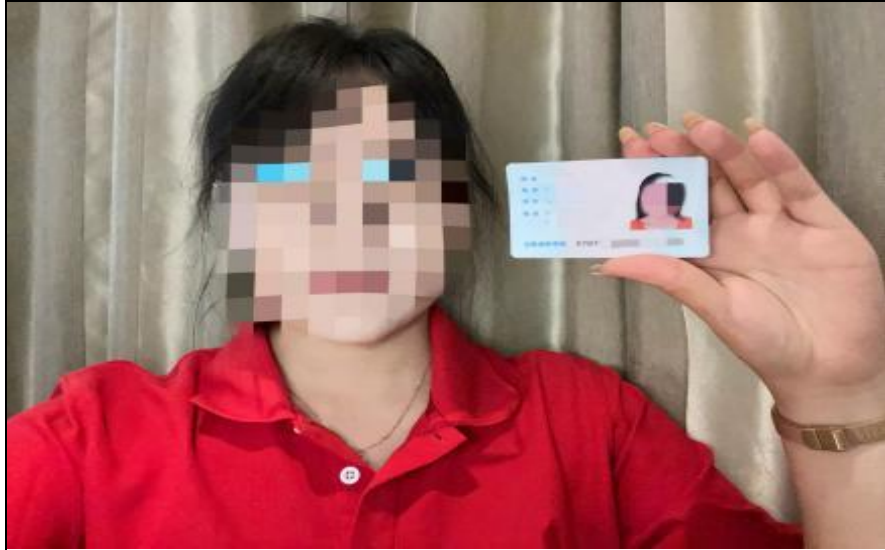
身份核验录制画面参考样例

参赛选手须于竞赛开始 15 分钟前，打开录音录像设备，在录音录像设备前清晰录制选手本人人像、身份证，自行录制完成身份核验并保持不中断录制到比赛结束（留存 15 个工作日待查）。