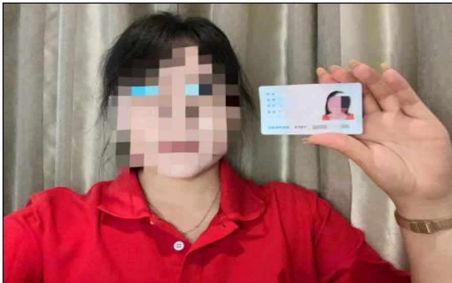
身份核验录制画面参考样例

参赛选手须于竞赛开始 15 分钟前，打开录音录像设备，在录音录像设备前清晰录制选手本人人像、身份证，自行录制完成身份核验并保持不中断录制到比赛结束（留存 15 个工作日待查）。